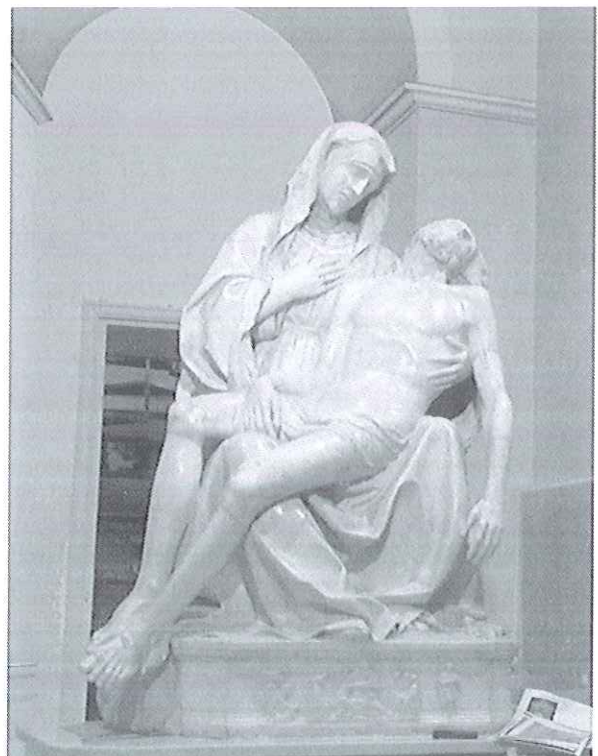
Pietà di Antonello Gagini